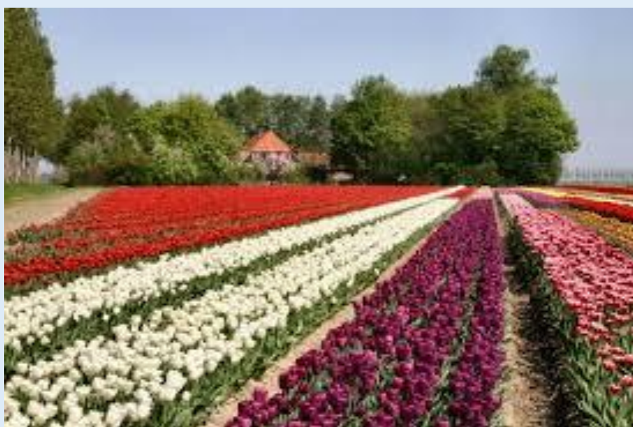
Voorjaar in Flevoland